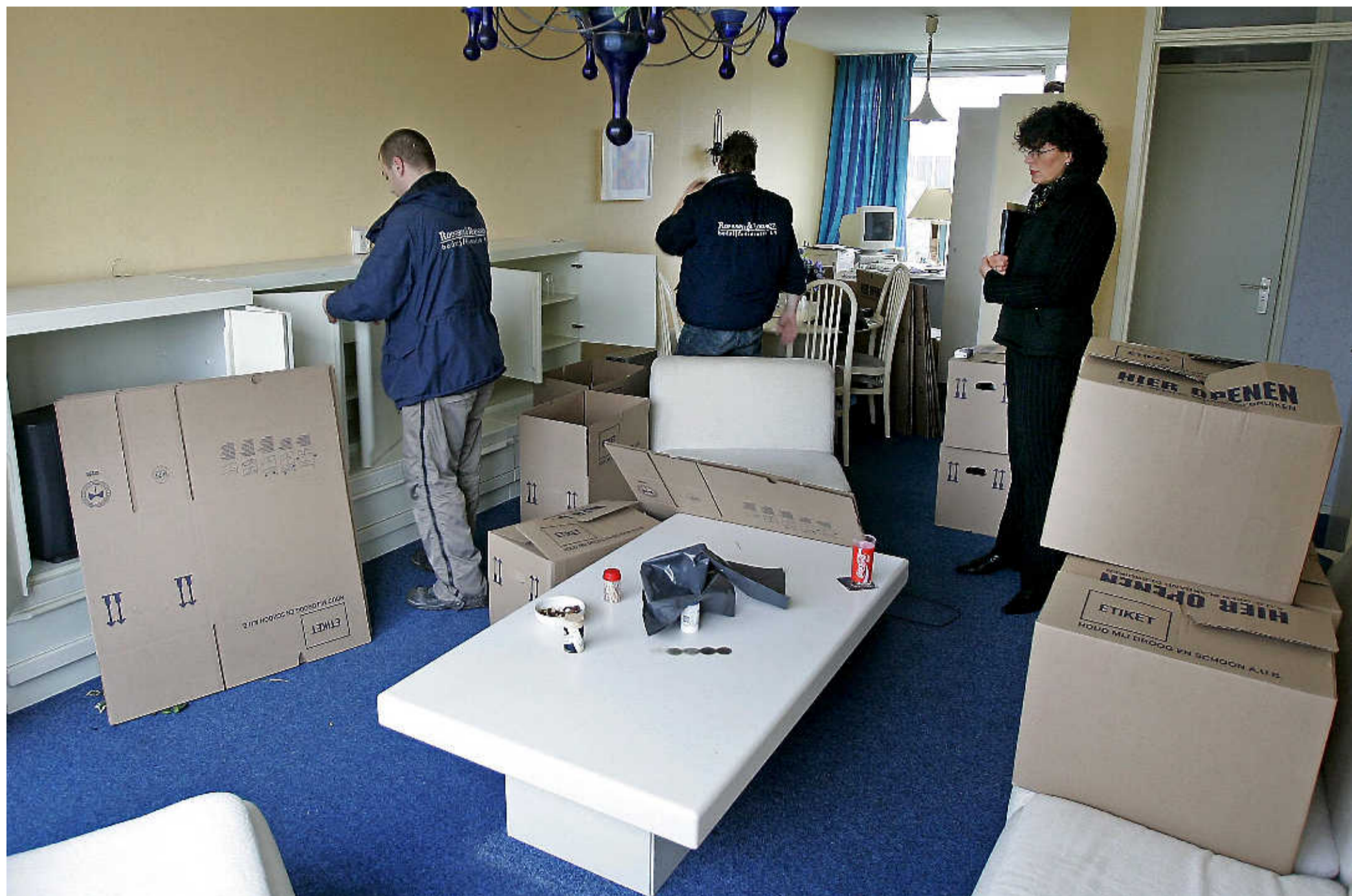
Gerechtsdeurwaarder, politie en verhuurder bij een ontruiming.

Eerlijk Daar kan ZVH niets tegen doen, wél tegen verlies aan huurinkomsten als gevolg van betaalgedrag. 'Vooral bij nieuwe huurders en in de vrije sector gaat het relatief vaak fout. De een zit met restschuld van de verkochte woning, de ander is jong en financieel onervaren. Inkomensgegevens controleren we strikter, door schade en schande wijs geworden. Tevens vragen we huurders of ze eventueel eerder, in een andere gemeente, betaalproblemen hebben gehad. De meesten zijn daar wel eerlijk over. Met jonge huurders gaan we even zitten. Die houden soms geen rekening met vaste lasten zoals zorgverzekering, gas en licht.' Alert blijven, bellen en huisbezoek voorkomen vaak opende huurschuld, is de ervaring. 'Er zit een