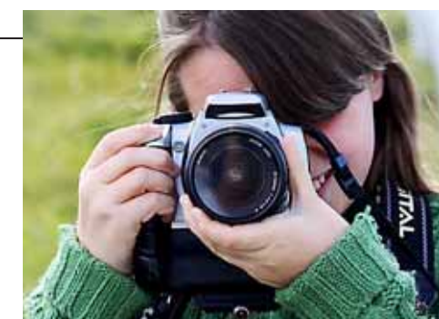
Verboden te 'schieten'.

Tijdens de nucleaire top NSS mag je nergens in de gemeente Haarlemmermeer met een camera of telelens rondlopen. Voor het hele gebied is dat verbod ingesteld. Natuurlijk moet een gemeente voorbereid zijn op de komst van zestig belangrijke regeringsleiders, maar om nu een fotoverbod in te stellen... Op internet wordt gemeld dat 1500 sporters uit binnen- en buitenland naar Schiphol willen komen om de verschillende regerings- en legeroestellen vast te leggen. Waarom zou je die fans dat niet gunnen? Dat fotoverbod is totaal over de top.